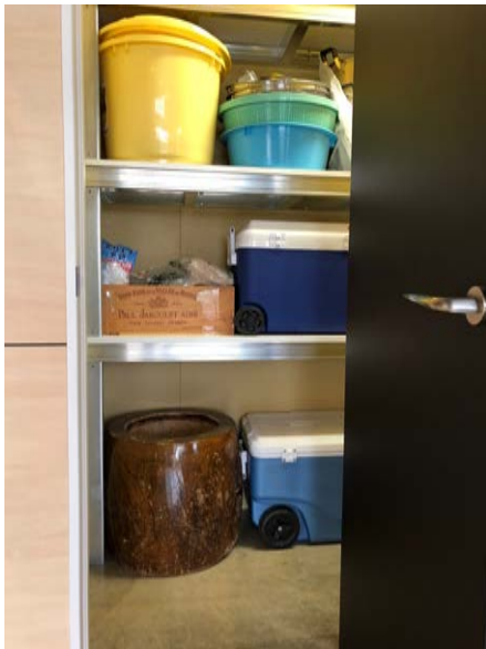
社内コミュニケーションツールがたっぷり詰まった倉庫