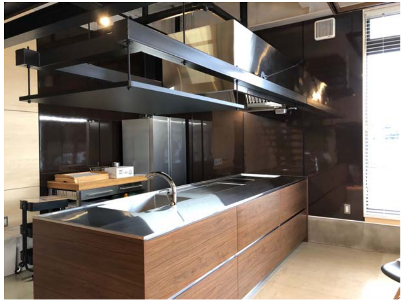
社員と家族を呼んでBBQを楽しむためのキッチン